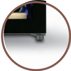
4 PIEDINI 4 ADJUSTABLE FEET